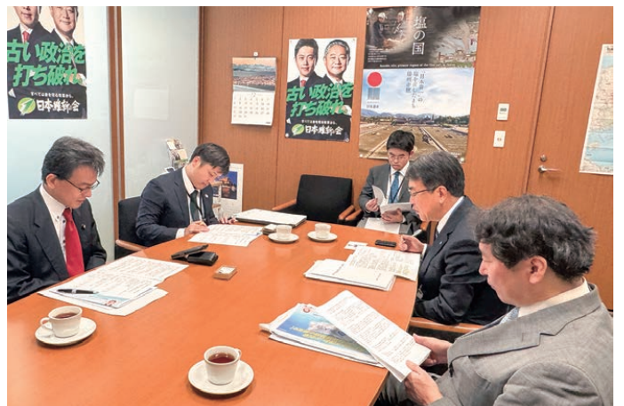
片山政務調査会会長代行（左手前）