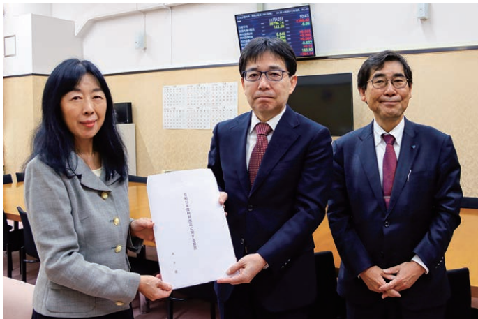
左から丸山税制副委員長、青木主税局長、田中専務理事